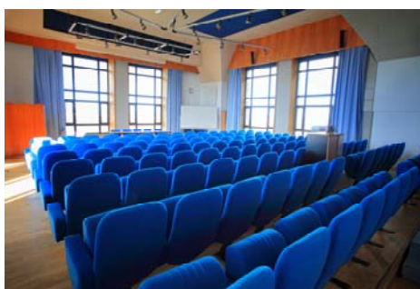
Auditorium (116 places)

Le centre de conférence est composé : d'une salle de conférence (2 ème étage du bâtiment Yves Delage) d'une capacité de 120 places, ainsi que de salles de réunions localisées dans le bâtiment Hôtel de France, dont la plus grande d'une capacité maximale de 45 personnes. Ces salles sont équipées de vidéo projecteur, ordinateur, tableau... Le technicien logistique est sur place en début de séance, et reste disponible durant toute la durée de l'évènement pour régler les éventuels problèmes techniques ou répondre à toute autre demande.