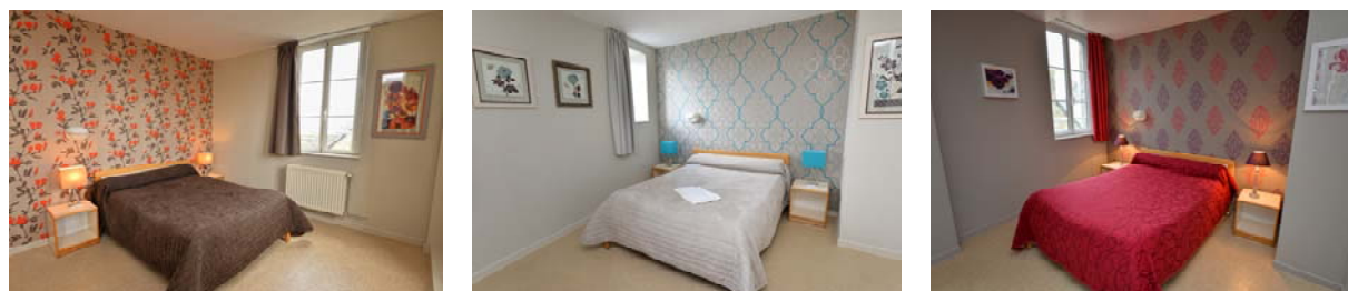
Chambre Hôtel de France

Le restaurant situé au rez-de-chaussée du Gulf Stream vous propose différents menus, préparés par les soins de nos cuisiniers, avec des produits frais et de saison.