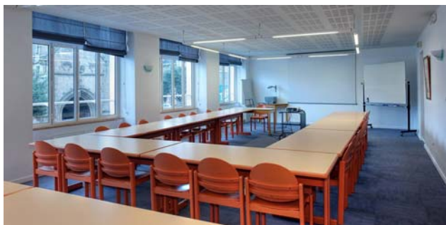
Salles de réunion (20 ou 40 places)